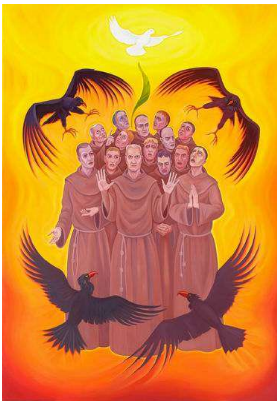
Obraz blahoslavených Čtrnácti pražských mučedníků Tomáše Císařovského