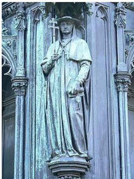
Socha Jana Očka z Vlašimi na podstavci pomníku Karla IV. na Křížovnickém nám. V Praze