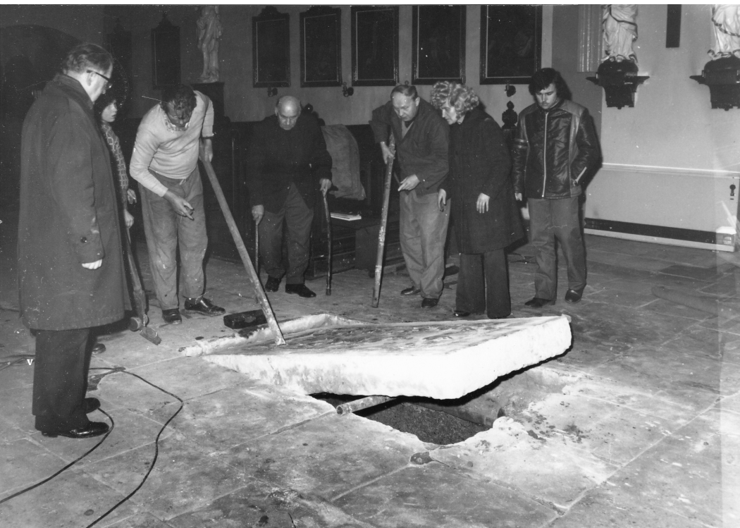
Otevírání vstupu do podzemí krypty 4. 12. 1979.