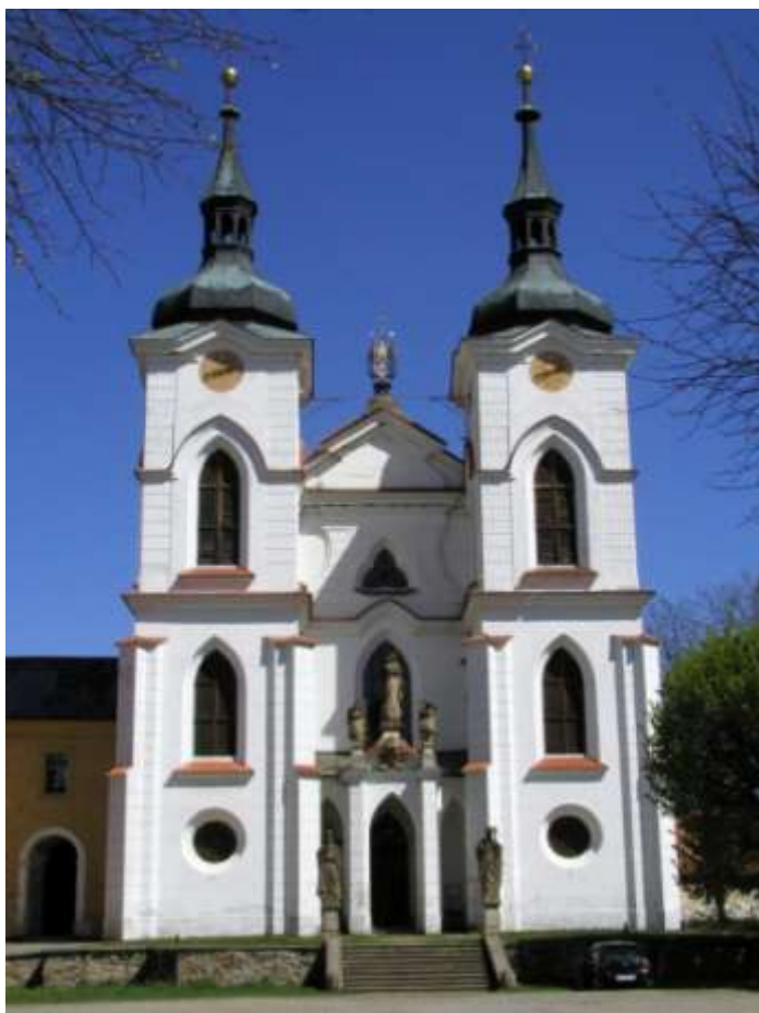
Kostel Narození Panny Marie v Želivě